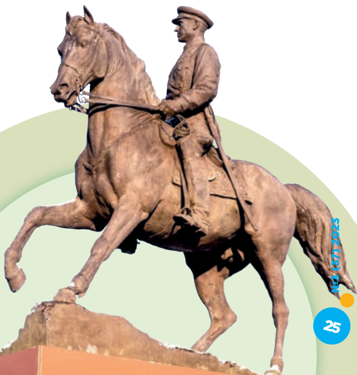
Памятник в г. Улан-Удэ маршалу Советского Союза К. К. Рокоссовскому