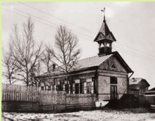
Внешний вид католического храма г. Верхнеудинск, 1930 г. ГАРБ. Ф.Р-248. Оп.3. Д.104. Л.28

Ребята, посмотрите, вдруг среди ваших друзей есть поляки. Как их определить, сейчас расскажем. Чаще всего поляков от других народов отличает звучание фамилии, они, как правило, заканчиваются на «ский», «ская», «цкий», «цкая», «дский», «дская». Поговорите с ними, узнайте их корни, традиции и обычаи, их национальные блюда. Это ведь так интересно.